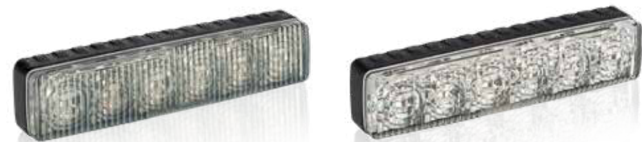
Vergleich Sputnik SL Smoky - Sputnik SL